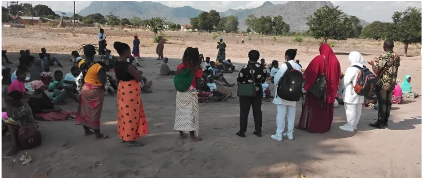
Fig1: Apresentação do Líder de MLC Fig2: Sessão Educativa tema: HIV/SIDA no Centro de Saúde de Rapale.