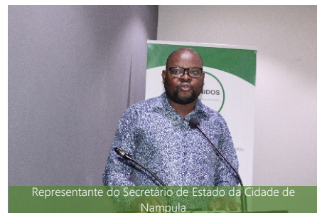
Representante do Secretário de Estado da Cidade de Nampula