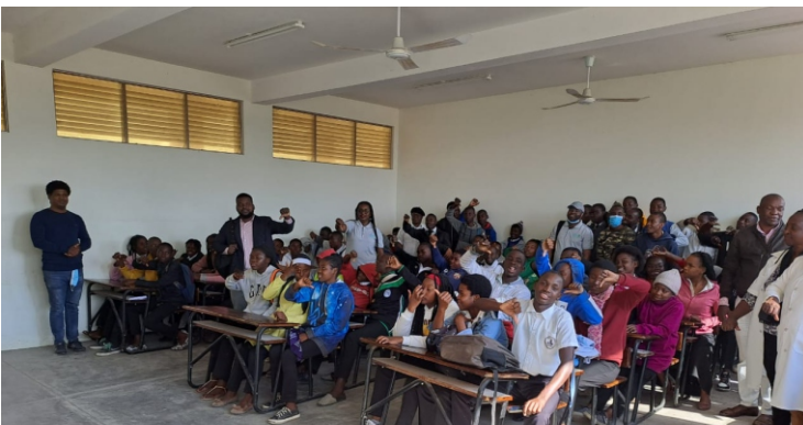
Escola Secundária Engenheiro Filipe Jacinto Nyusi - Boane