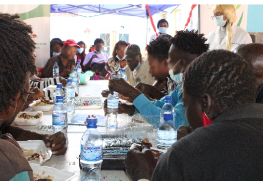
O almoço beneficente favoreceu a cerca de 40 beneficiários

O evento beneficente despertou, igualmente, a atenção de diversos actores. Como é o caso da Mais Vida – uma seguradora nacional que actua na área de saúde e a AVOMACC - Associação Voluntária de Mães e Crianças Carenciadas que se juntaram a causa.