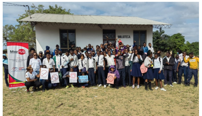
Escola Secundária da Katembe