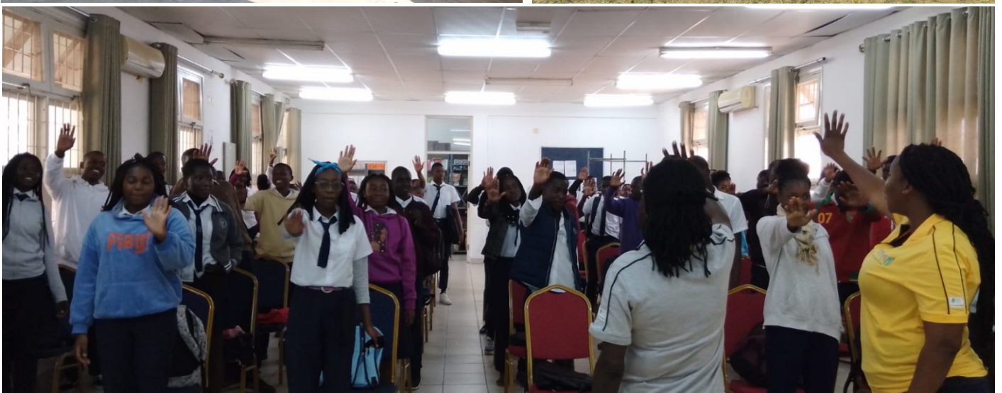
Escola Secundária Magoanine B