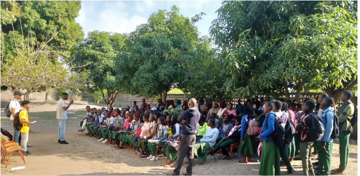
Palestra na Escola Secundária da Manhiça