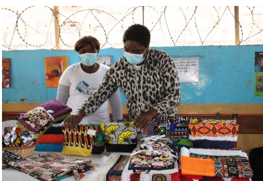
AVOMACC expõe seus produtos no evento beneficente