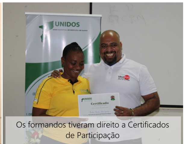
Os formandos tiveram direito a Certificados de Participação