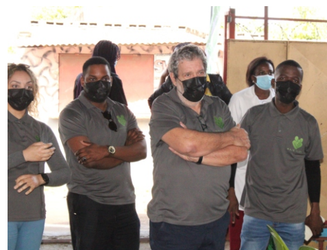
Equipa da Mais Vida