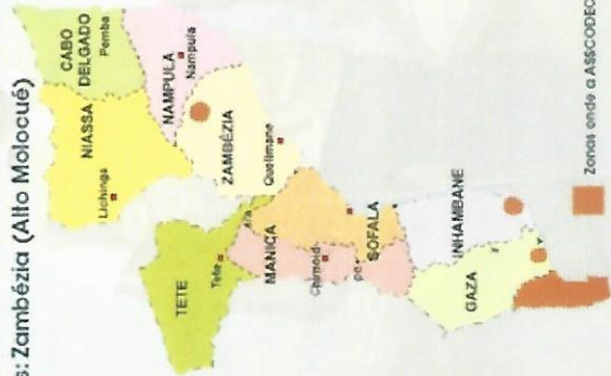
Zonal onde a ASSCODECHA actua